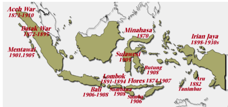
Perlawanan Penting hingga awal abad XX